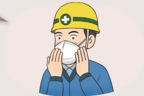
호흡용 보호구(황사 마스크 등)