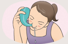
코를 자주 세척